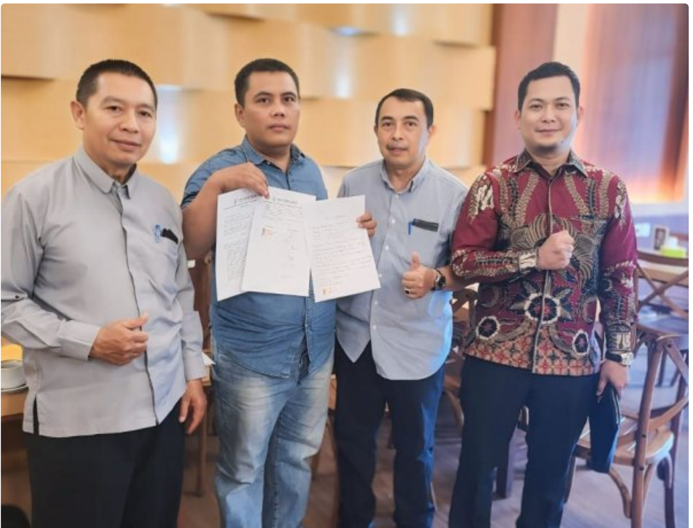
Kuasa Hukum Ningto Wahyu Dens & Partners Lawfirm di perkara Dugaan Pemalsuan Data dan Kredit Fiktif di Bank BRI Unit Kalideres.

JAKARTA, JNI - Seorang bekas nasabah Bank BRI, yang dikenal dengan inisial NW, melaporkan dugaan pemalsuan data dan kredit fiktif yang melibatkan oknum